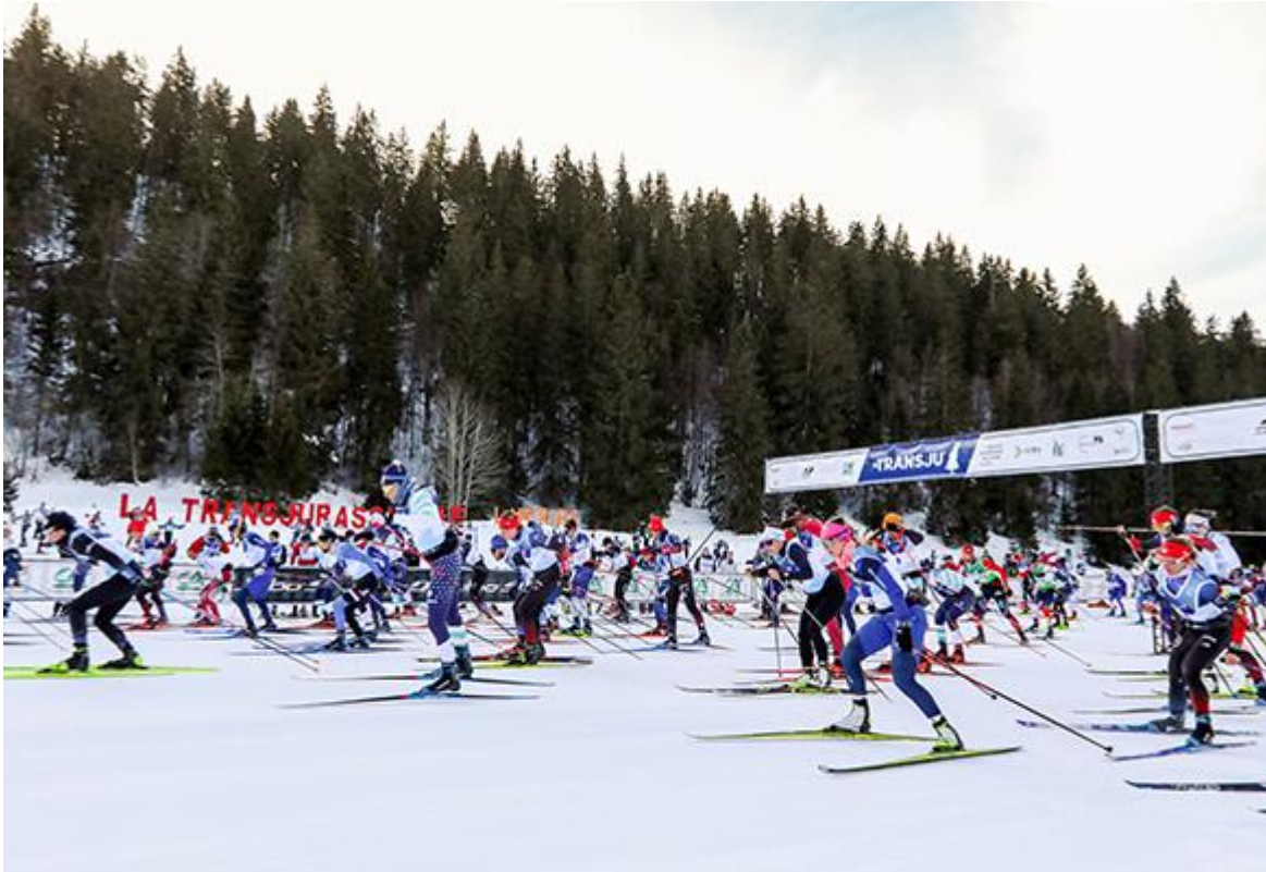
Cliquer sur l'image pour la télécharger - © M.Lucatelli Zoom / La Transju'